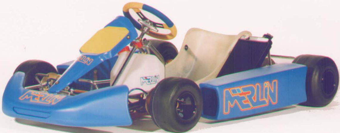
Photo du Kart avec carrosserie et pneumatiques

This homologation sheet reproduces descriptions, technical drawings and dimensions at the moment of the FMK-FIA homologation. With its homologation application, the applicant confirms, that all the requirements of the regulations are respected in full.